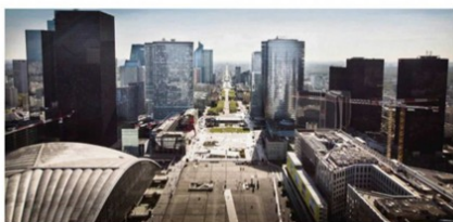
Vue depuis le toit du grand monument culmine sur le Miroirant sur l'axe historique reliant la Défense au Louvre.

CALENDRIER La rénovation sera totalement achevée en 2019.