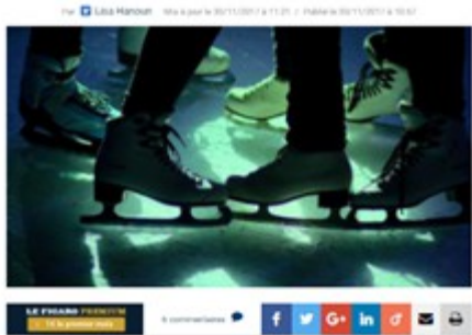
Du 15 décembre 2017 au 14 janvier 2018, le rooftop de la Grande Arche se transforme en patinoire géante à 110 mètres de hauteur.